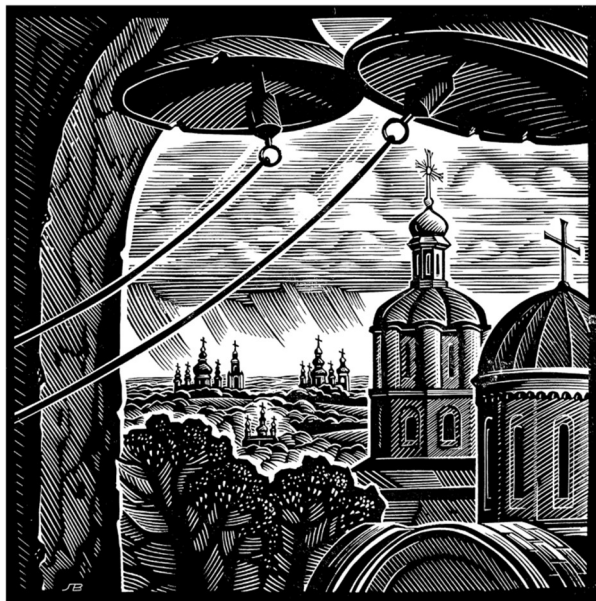
Рис. 1. Леоненко В. «Дзвони Чернігова». Ліногравюра. 1998 р. З особистої колекції автора

В. Леоненка гідно представлена в Міжнародній енциклопедії екслібриса, яка виходила у Португалії [6, сс. 87-104].