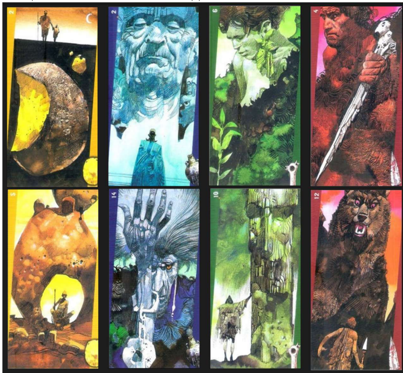
Рис. 1. Tonpi C. Карти Молодших Арканів «Primordial Tarot».

карт, а цілковито новий погляд, який викликає у глядача не раціональне прочитання, а емоційно-інтуїтивний резонанс і асоціативний зв'язок із невідомим.