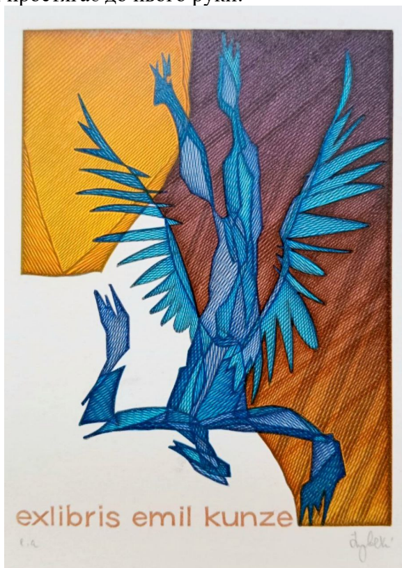
Рис. 6. Пугачевський Г. Екслібрис Еміля Кунзе. Гравюра на пластику. 1997 р.

плані екслібриса постає схематична постать Еврідіки, яка у безсиллі простягає до нього руки.