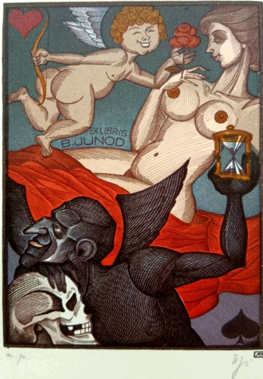
Рис. 5. Пугачевський А. Київ. Екслібрис Б. Джюно. Гравюра на пластичу. 1995 р.

графіки до кольорової й прославились у світі. У 1995 р. Аркадій Пугачевський розвинув амурну тему, зобразивши у композиції, надрукованій із семи дощок, не лише грайливого Амура, який вручає червону троянду оголеній красуні, а й грізного Танатоса (в грецькій міфології – уособлення смерті), що однією рукою спирається на череп людини, а другою тримає пісочний годинник – нагадування про швидкоплинність життя (рис. 5).