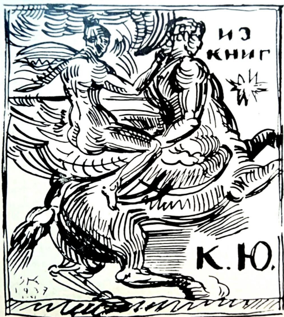
Рис. 2. Конончук С. Київ. Из книг К. Ю. Туш. перо. 1937 р.

аркуша, замінивши власницькі написи назвою книги «Сергій Конончук. Графіка» [6].