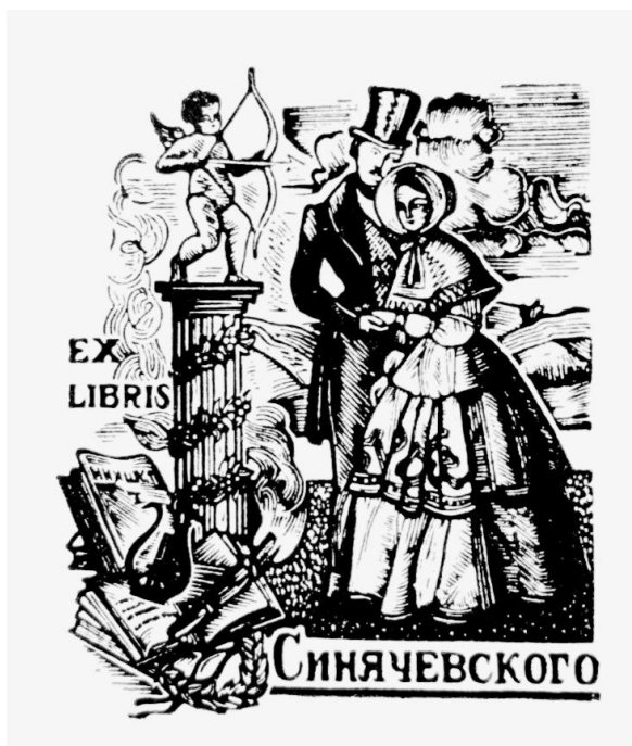
Рис. 1. Сахновська О. Київ. Екслібрис Синячевського. Гравюра на дереві. 1928 р.