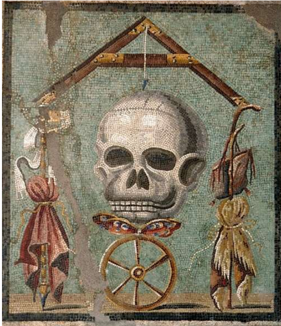
Рис. 1. «Memento mori». Мозаїка. 47 x 41,5. I ст. до н.е. Неапольський національний археологічний музей. Італія (твір є суспільним надбанням та знаходиться у відкритому доступі: https://salo.li/C68dA48 ).

У пізньому Середньовіччі тема «Memento mori» розкрито через мотив танцю, відомого у мистецтві Західної Європи як «Danse macabre» («Totentanz» у Німеччині, «Danse macabre» у Франції, «Danza de la muerte» в Іспанії, «Doodendans» у Нідерландах, «Ballo della Morte» в Італії, «Dance of Machabree» в Англії) [3, с. 11]. Причиною стрімкого поширення цього мотиву стала епідемія Чорної смерті в сер. XIV ст. та втрати, спричинені Сторічною війною між Францією та Англією (1337-1453 pp.) [9]. Іконографія алегоричного образу є зображенням фігур живих і померлих людей різної статі, віку та статусу: жінки і чоловіки, діти й дорослі, королі та жебраки, об'єднаних