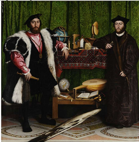
Рис. 5. Ганс Гольбейн Молодший. «Посли». Дубова дошка, олія. 207 x 209. 1533. Національна галерея. Лондон, Велика Британія (твір є суспільним надбанням та знаходиться у відкритому доступі https://salo.li/ed100CE ).

Особливий погляд, який потрібний для споглядання картини (під гострим кутом), перетворює анаморфозне зображення на першому плані композиції на череп – нагадування про смерть та ілюзорні цінності людського життя. Ідеєю використання такого прийому художньої виразності є спосіб подвійного бачення: при прямому погляді на твір для людини, зануреної в рутину побуту, смерть – ілюзорна пляма, на яку не варто звертати увагу. Але при особливому глибокому погляді, який передбачає усвідомлення побаченого, все змінюється — смерть перетворюється на єдину реальність, а звичайне життя спотворюється, позбавляється значення, набуваючи характеру фантому та ілюзії.