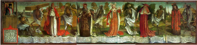
Рис. 2. Бернт Нотке. «Danse Macabre». Олія, полотно. 160x750. 1475-1499 рр. Таллінський музей мистецтв. Естонія (твір є суспільним надбанням та знаходиться у відкритому доступі: https://salo.li/b44eAEed )