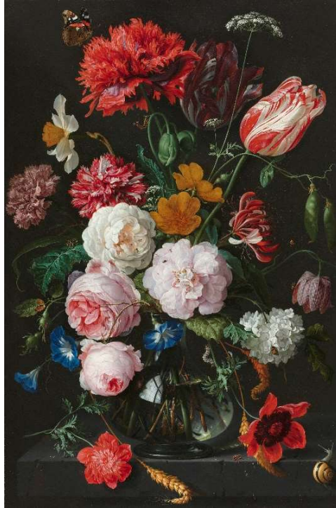
Рис. 6. Ян Давідс де Хем. «Натюрморт із квітами в скляній вазі». Мідь, олія. 54,5 x 36,5. Між 1650 та 1683 рр. Державний музей (Рейксмузеум). Амстердам, Нідерланди (твір є суспільним надбанням та знаходиться у відкритому доступі: https://salo.li/D9VcE4c )

дрібні тварини, що мешкають на землі і під нею (миші, щури та плазуни); надія людини на життя після смерті, покладена на Бога (розп'яття, хрести та інші атрибути віри) [21].