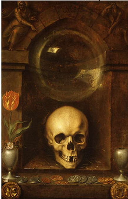
Рис. 5. Якоб де Гейн. «Vanitas». Дошка, олія. 82,6 x 54. 1603 р. Метрополітен-музей. Нью-Йорк, США (твір є суспільним надбанням та знаходиться у відкритому доступі: https://salo.li/e10E13D

короткоденна і пересичена печалями: як квітка, вона виходить і опадає; тікає, як тінь, і не зупиняється» [1].