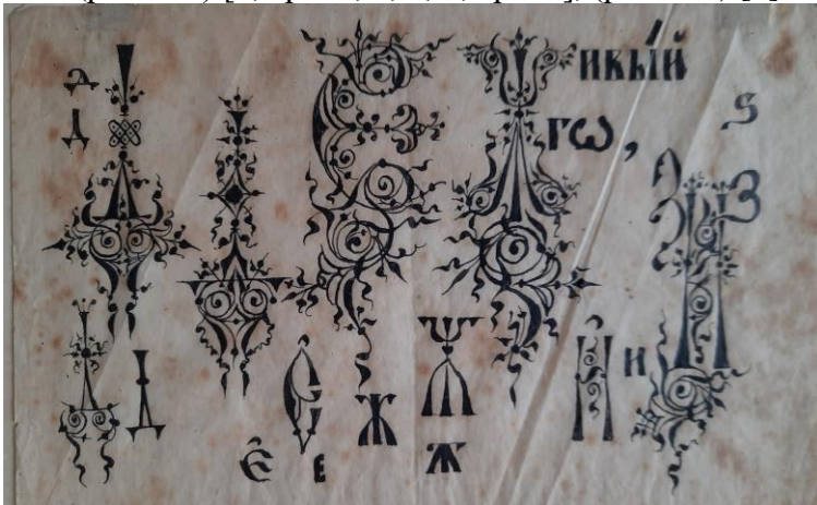
Рис. 1. Фотокопія орнаментально-шрифтової розробки Івана Сидоровича Їжакевича дореволюційного періоду. Калька, туш, перо. Фонд 58 ЦДАМЛМУ, оп. 1, спр. 59, арк. 3. м. Київ.

У цьому сенсі важливо зрозуміти, що при цьому автор не йшов шляхом звичайної компіляції, коли поєднувалися репліки уставного письма, скоропису, використовувались зарубки, живописна контрастність, петлі, розчерки, плетінчасті композиції. Натомість Іван Сидорович у своїх шрифтологічних пошуках намагався синтезувати візантійські, готичні й неоруські рефлексії, орнаментальний стрій яких був близьким візерункам гравірування художнього скла та ковки художнього металу, наче передрікаючи «танцюючі» мотиви ар деко поч. ХХ ст. (рис. 1-4) [2, арк. 1, 2, 3; 3, арк. 3], (рис. 5-6) [3].