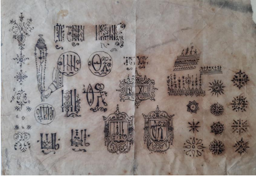
Рис. 6. Фотокопія орнаментально-шрифтової розробки Івана Сидоровича Їжакевича дореволюційного періоду. Калька, олівець. Фонд 58 ЦДАМЛМУ, оп. 1, спр. 59, м. Київ. Публікується вперше.

In particular, these are cases 59, 60, 61, 64, 65 of description 1 of fund 58 – “Izhakevich I. S. – Ukrainian Soviet artist, People's Artist of the Ukrainian SSR”. The most interesting of them is case 59 – “Samples of Church Slavonic fonts and ornaments”, which contains three sheets with sketches of font and ornamental compositions drawn with ink pen and graphite pencil on tracing paper (undated, made around the turn of the 19 th and 20 th centuries).