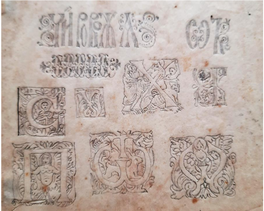
Рис. 4. Фотокопія орнаментально-шрифтової розробки Івана Сидоровича Їжакевича доєволюційного періоду. Калька, олівець. Фонд 58 ЦДАМЛМУ, оп. 1, спр. 60, арк. 3. м. Київ. Публікується вперше.