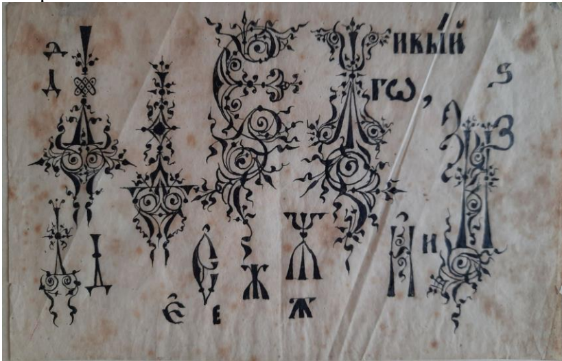
Рис. 5. Фотокопія орнаментально-шрифтової розробки Івана Сидоровича Їжакевича доволюційного періоду. Калька, олівець. Фонд 58 ЦДАМЛМУ, оп. 1, спр. 59, м. Київ.