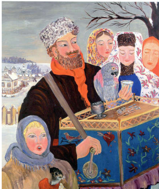
Рис. 8. Северцова Н. А. «Шарманщик». Начало 1960-х годов. Картон, масло. Коллекция музея Царицыно

изображен в фас и прерывается в центре белой фигурой игуменьи.