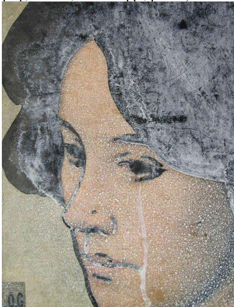
Рис. 1. Соколов О. «Жіночий портрет». Туш, білила, аерограф. 1960-і рр. З відкритих джерел: https://surl.lu/ldmvxf

писати. Але це було лише етапом становлення, доказом його професійної спроможності. Портрети раннього етапу є свідченням його професійного рівня. Як живописні, так і графічні. Графічні аркуші часто створювалися в максимально лаконічній, інтелігентно-стриманій манері, в якій явно простежується вплив ще «мирискусників», якими він захоплювався при навчанні. Навіть уже в цих роботах бринить той настрій, який стане домінуючим незабаром, коли спроби майстра якось існувати в унісон з оточуючим мистецьким середовищем будуть визнані ним самим марними («Жіночий портрет на різнокольоровому тлі», чорнило, фломастер, туш, 1960-і рр.; «Жіночий портрет», туш, аерограф, білила, 19600-і рр., рис. 1).