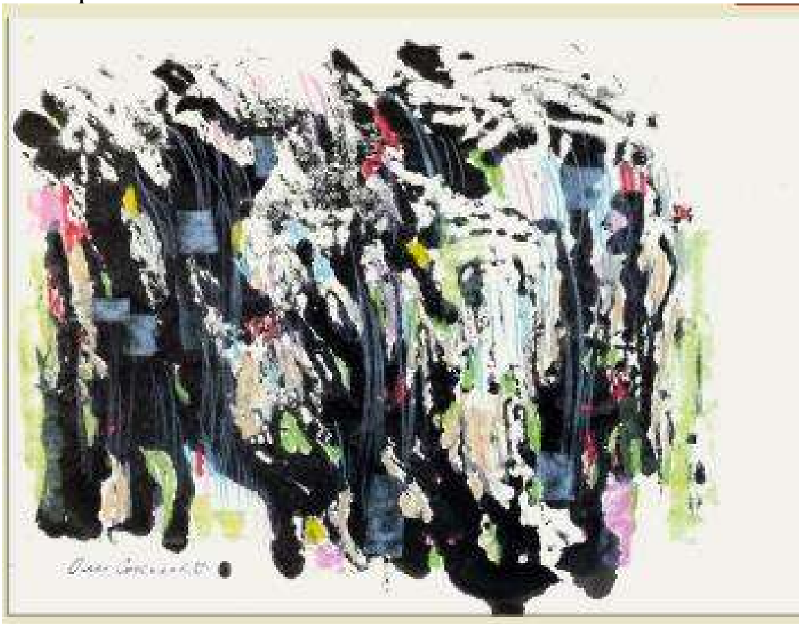
Рис. 4. Соколов О. «Без назви». Мішана техніка, 1985 р.

назви» 1980-х рр., 1983 р., 1984 р., 1985 р. (усі – мішана техніка). Такою є і «Без назви» 1985 р. (мішана техніка, рис. 4), яка, мабуть, є однією з найпоказовіших – за основу взято чорно-білу хвилю, підцвічену неактивними кольоровими сплесками.